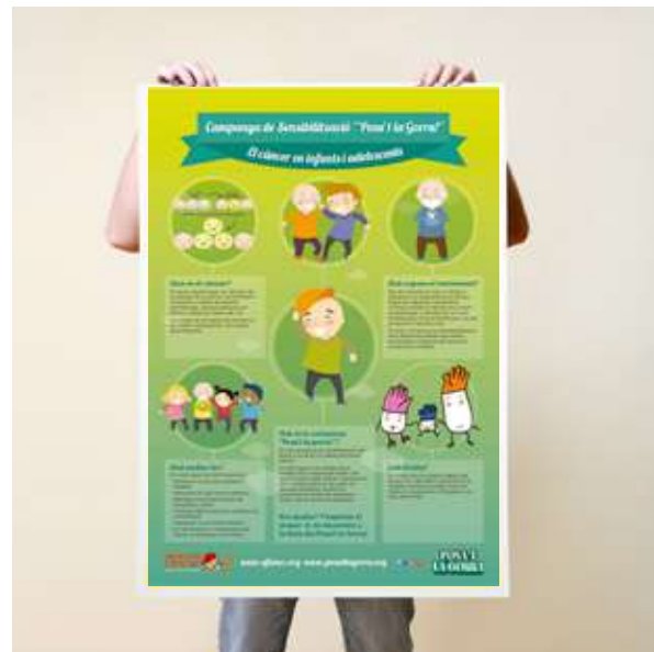
Cartells didàctics per les escoles